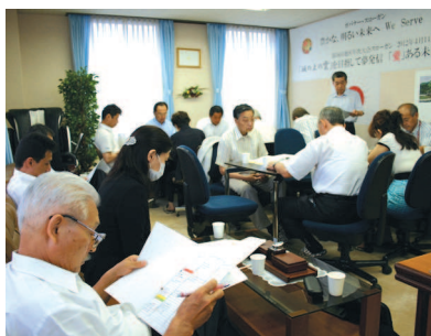
▲キャビネット内局準備会(7月1日)