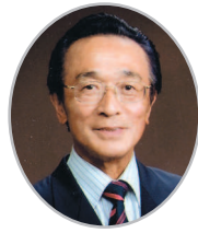
1 ZC 南 博 (北島)

ウィ・サーブの原点に帰り、微力ながら一生懸命責務を果たして参りたいと思っております。地区ガバナーの方針を理解し、リジョン・チェアパースンのご指導を受けながら、ゾーン内クラブの発展と、活発な奉仕活動が出来るようお手伝いさせていただきます。