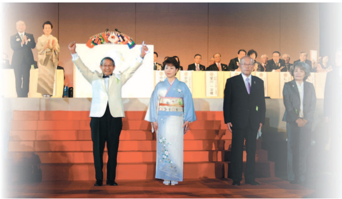
▲第57回 336-A地区年次大会にて

「自分は世の中の為にほんの僅かも役にたつのだろうか」そんな愛と思いやりの心で、自分たちの出来ることを会員同士のあつい情熱と強い絆で、ライオンズライフを探究していきましよう。