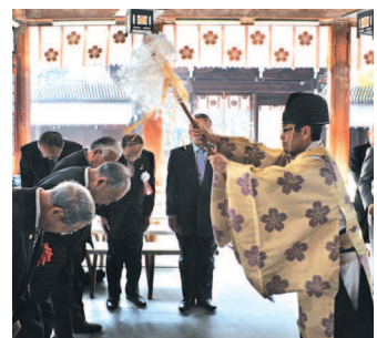
▲事務局開設式(護国神社)にて <2011年2月6日>