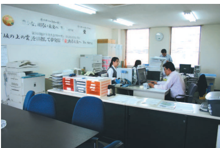
▲ガバナーの社屋の一室を事務局に。