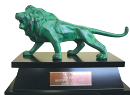
(公認ガイディング・ライオン賞)