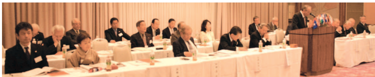
▲初の研修会。すっかり緊張のキャビネット役員。