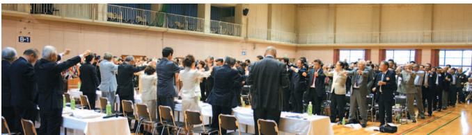
▲参加クラブ紹介の上、ローアで絆を誓う、全体会。