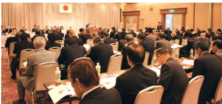
▲約100名の次期キャビネットを支える地区役員と委員の研修。