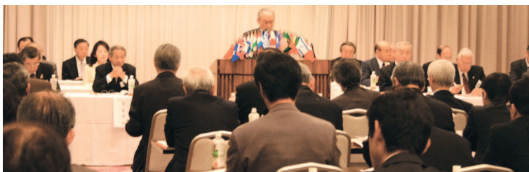
▲来賓の挨拶は、まず東日本大震災への哀悼の意を表することにはじまる。そして、今こそライオニズムの必要性を説く。

つづいて各委員長から常設委員会の活動方針が発表された。引き続き、分科会においてキャビネットの簡素化、効率化を図るための一つとして、各地域の委員は地域密着を活かし、地区委員長の代わりを担い、積極的に地域を指導、活動を推進するよう要請した。