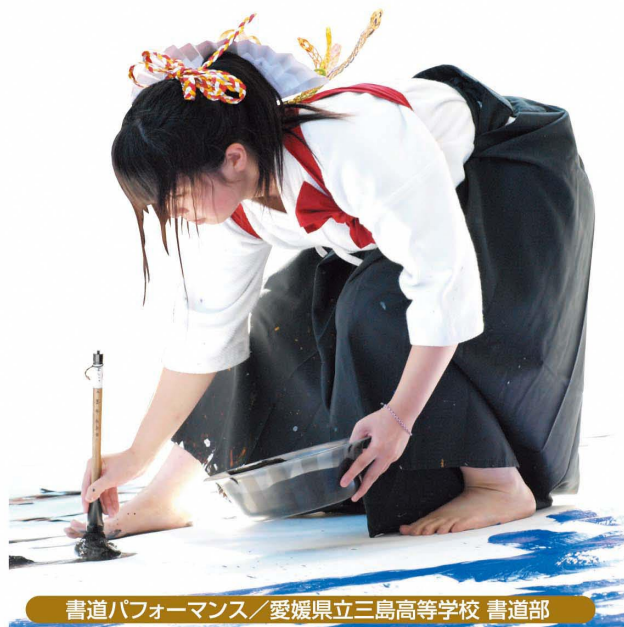
書道パフォーマンス/愛媛県立三島高等学校 書道部