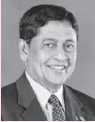
2007～2008年度 ライオンズクラブ国際協会 国際会長 マヘンドラ・アマラスリヤ