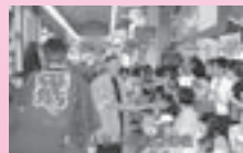
夏のよさこい祭り