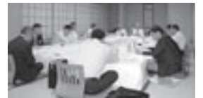
青少年・LCIF・市民奉仕・児童奉仕委員会