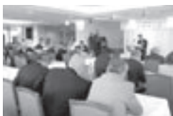
CSF II セミナー