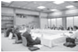
会員・会則・EXT・指導力育成・プロトコール委員会