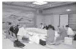
環境保全・保健福祉委員会