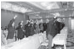
CSF II 特別委員会の決意表明