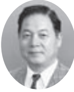
6R 中山土志延 (高知)