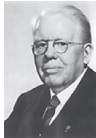
メルビン・ジョーンズ