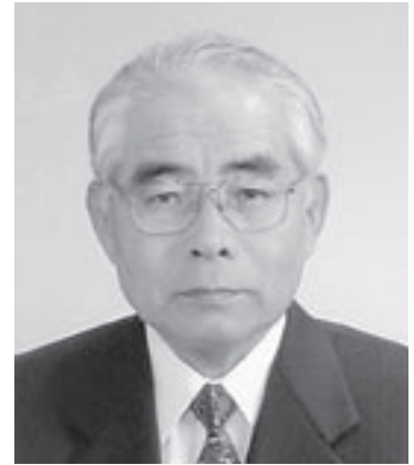
前地区ガバナー 地区名誉顧問会 議長