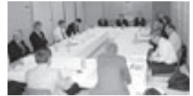
PR・ライオンズ情報・大会参加委員会