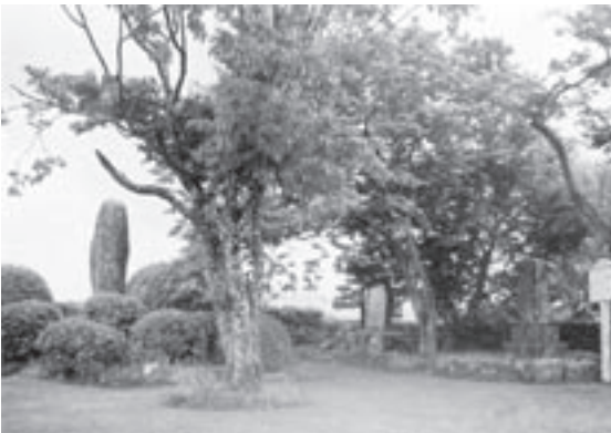
「紀氏旧跡」の石碑群 向って右端が春水の碑、左端が大正の碑、中央が平成の碑。その右脇が命を継ぐ桜。

同じ樹の下蔭に少し離れて、白河染翁(幕府老中松平定信)の文化六年(一八〇九)撰文を刻んだ碑と由来書きの副碑(大正九年(一九二〇)建立)。乾常美氏(国府史跡保存会顧問)の語る通り、春水の依頼後二十年して染翁撰文が届き、藩に仕舞われていたのを郷土史家寺石正路氏が発見し、山内十七代豊侯爵の家額「千載不朽」を戴いて建立(春水の発願以来百三十五年にして成ったこととなる…)。まことに当時の国府村民が如何に感奮興起したかは想像に難くありません(ガイドブック「国府の史跡」)。