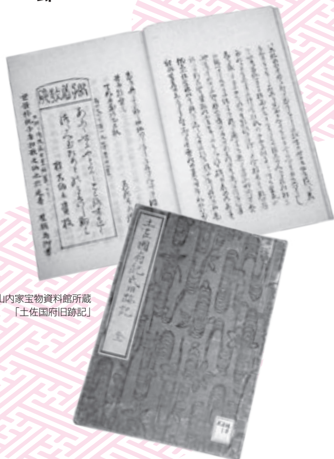
土佐山内家宝物資料館所蔵 「土佐国府旧跡記」

巻末の一文こそ、春水の真骨頂と信じて、私は本意を損ねる畏れを秘めつつ、敢えて要約する―今は一面の田となり名のみ残るのを、里人は「只紀氏の事のみ知りて昔をしのび」いつしかこの伝承も失われようと悲しみ、石文を建てておこうと思うが、力及ばぬと嘆く。この春、絵図にしたくて同志と共に来た春水は「里人の志」を感じて、村長を通じ郡司に上申させた。「絶えたるを継ぎ廃したるを興させ給ふ時」だったから