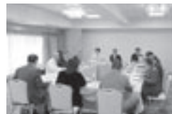
YE・国際協調委員会