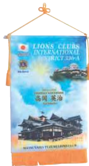
〈松山城と道後温泉〉