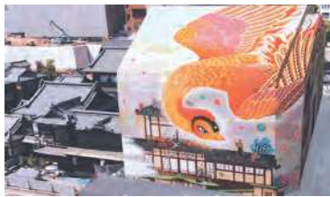
道後温泉本館 ラッピングアート 「火の鳥」