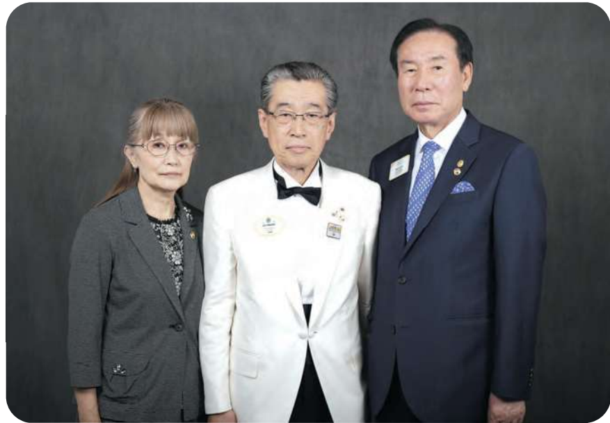
ジュンヨル・チョイ国際会長と記念撮影 (2019年7月8日)