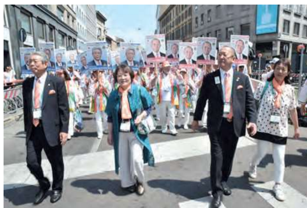
2019.7月6日 国際大会(イタリア・ミラノ)パレード